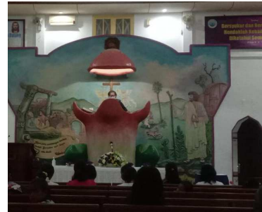
Gambar 5. Gambar mimbar bentuk buah cengkeh, Gereja Nehemia, Jemaat GPM Nehemia Benteng, Kota Ambon