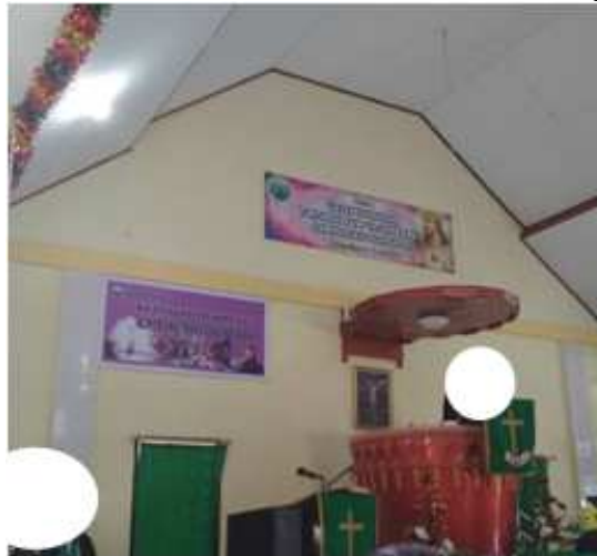
Gambar 3. Mimbar bentuk tifa, Gereja Elim, Jemaat GPM Kairatu, Kab. Maluku Tengah