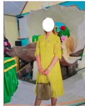
Gambar 11. Mimbar bentuk kulit kerang Mutiara, Gereja Sumber Kasih, Jemaat GPM Taar, Kota Tual

https://www.dharapos.com/2021/11/gedung-gereja-ralalolin-wunlah-resmi.html