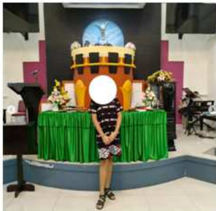
Gambar 1. Mimbar bentuk tifa, Gereja Petra, Jemaat GPM Imanuel OSM, Kota Ambon