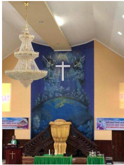
Gambar 4. Gambar mimbar bentuk bunga cengkeh, Gereja Imanuel, Jemaat GPM Amahusu, Kota Ambon

a) Flora dan fauna esensial yang hidup di darat