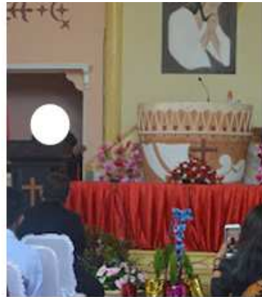
Gambar 2. Mimbar bentuk tifa, Gereja Elim, Jemaat GPM Petra Karang Panjang, Kota Ambon