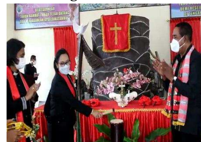
Gambar 9. Mimbar bentuk pohon sagu, Gereja Papora, Jemaat GPM Papora, Kab. Seram Bagian Barat