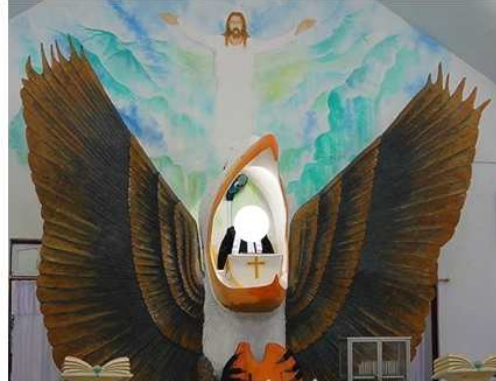
Gambar 13. Mimbar bentuk burung cendrawasih, Gereja Jatorlolin, Jemaat GPM Doklai, Kab. Kepulauan Aru