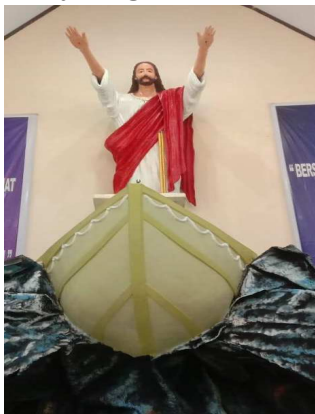
Gambar 14. Mimbar bentuk perahu, Gereja Kabalsian, Jemaat GPM Kabalsiang, Benjuring, Kab. Aru

Beberapa mimbar GPM juga ada yang berbentuk perahu. Bentuk perahu menggambarkan profesi masyarakat lokal umat GPM. Pada gambar 14 dan 15, mimbar yang berbentuk perahu disesuaikan dengan ciri khas masing-masing daerah. Pada gambar 14 mimbar berbentuk perahu di Jemaat Kristen di Kepulauan Aru dilengkapi dengan elemen lautan. Sedangkan pada gambar 15, mimbar berbentuk perahu dilengkapi bola bumi dengan tambahan elemen peta Indonesia. Gambar tersebut secara langsung menegaskan konteks gereja yang diutus di tengah dunia. Terlepas dari filosofi gerejawi, perahu adalah simbol dari alat yang digunakan oleh nelayan untuk mencari ikan di laut. Mimbar berbentuk perahu secara tidak langsung merepresentasikan jenis pekerjaan yang dilakukan oleh sebagian besar masyarakat yang berada di kedua tempat. Kedua jemaat GPM tersebut hidup di area dekat laut, yang mengakibatkan sebagian besar masyarakatnya berprofesi sebagai nelayan.