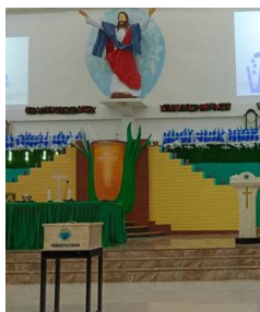
Gambar 8. Mimbar bentuk buah jagung, Gereja Sumber Kasih, Jemaat GPM Marlbali, Kab. Aru