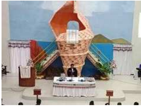
Gambar 10. Mimbar bentuk bia lola, Gereja Ralalolin, Jemaat GPM Wunlah, Kab. Tanimbar