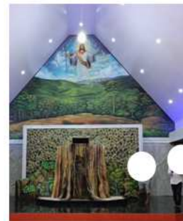
Gambar 7. Mimbar bentuk pohon kayu, Gereja Manusa, Jemaat GPM Manusa, kab. Seram Bagian Barat