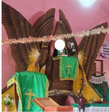
Gambar 12. Mimbar bentuk burung cendrawasih, Gereja Solagracia, Jemaat GPM Dobo, Kab. Kepulauan Aru