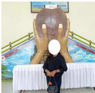
Gambar 6. Mimbar bentuk buah kelapa, Gereja Imanuel, Jemaat GPM Adaut, Kab. Tanimbar Selatan