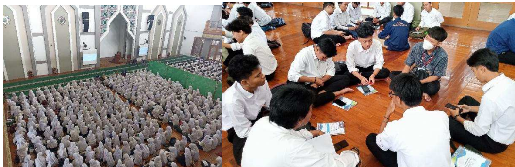
Gambar 3. Salah Satu Kegiatan dalam Tutorial PAI di UPI