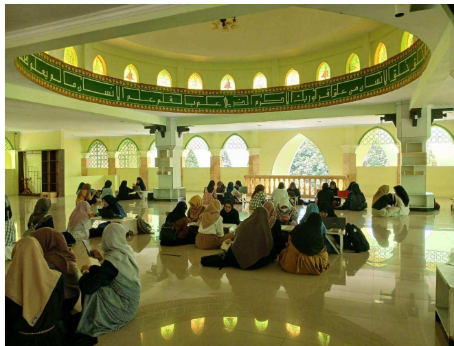
Gambar 2. Salah Satu Kegiatan dalam Tutorial PAI di UNY

Proses pelaksanaan penguatan moderasi beragama yang dilakukan melalui tutorial keagamaan dilakukan dengan internalisasi nilai dan keteladanan. Proses internalisasi nilai ini merupakan kegiatan dimana mahasiswa menyimak materi moderasi beragama yang disampaikan oleh dosen. Selain itu, proses kegiatan internalisasi nilai juga disampaikan oleh mentor/tutor ketika kegiatan mentoring. Di samping internalisasi nilai, penguatan moderasi beragama juga dilakukan dengan cara menjadikan peserta lain sebagai contoh teladan. Lembaga tutorial yang dalam hal ini membuka dua jalur khusus peserta tutorial, yaitu jalur reguler dan binder, berharap supaya peserta tutorial yang mengambil jalur binder dapat menjadi teladan bagi peserta lainnya yang mengikuti kegiatan tutorial keagamaan jalur reguler. Berdasarkan keterangan wawancara, pelaksanaan kegiatan program tutorial ini tentunya tidak terlepas dari adanya kebijakan universitas serta lingkungan sekitar yang mendukung.