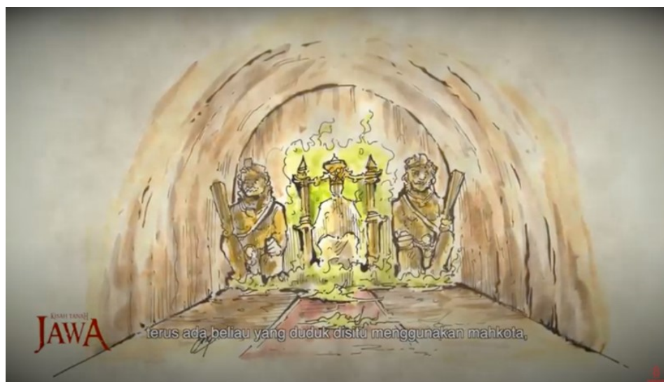
Gambar 4. Pola narasi visualisasi yang ghaib

Dalam visualisasi sebagai bagian dari pola narasi atas yang gaib tidak hanya menggambarkan mengenai rupa dan tempat, namun juga lengkap dengan apa yang sedang makhluk itu rasakan. Dalam tayangan di Nusakambangan yang begitu panjang, ia memvisualkan penderitaan yang dialami perempuan Jawa akibat dari pemerkosaan yang dilakukan penjajah masa itu. Divisualkan perempuan itu memakai kemben -pakaian tradisional Jawa-, tampak diikat dengan rantai besi yang dinarasikan Om Hao bahwa ia diperkosa dan menjadi pemuas nafsu penjajah kala itu. Pola narasi ini bisa ditemukan secara berulang di berbagai video dalam Kisah Tanah Jawa. Om Hao mencoba menghadirkan deskripsi secara lebih dekat dari makhluk-makhluk yang ia temui. Sudah barang tentu hal ini semakin menarik sebagai framing dan upaya meyakinkan viewer -nya bahwa hal itu merupakan realitas yang ada. Dalam konteks yang demikian tampak ada pertemuan antara yang mistik-magis dengan kecanggihan teknologi visual yang biasa disebut dengan realitas virtual (Yoh, 2001).