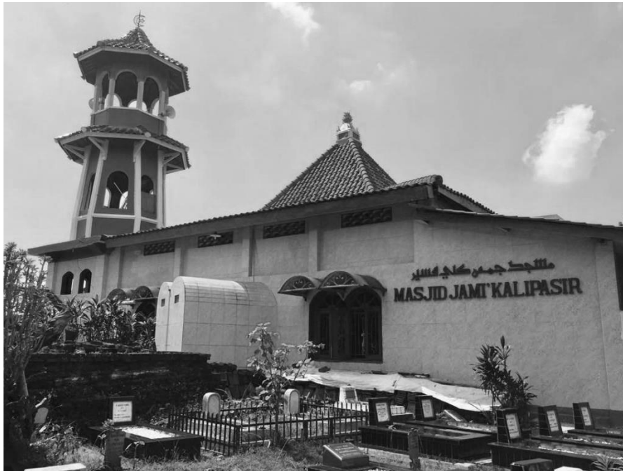
Gambar 1. Masjid Jami Kalipasisir

Syairoji menegaskan, masyarakat Kalipasisir menjaga hidup harmoni di tengah kemajemukan. Masyarakat di Kalipasisir membangun moderasi beragama dalam aktivitas sosial sehari-hari. Hal paling mencolok dari moderasi beragama itu, misalnya saat perayaan hari keagamaan, mereka saling bergotong-royong. Ketika umat Tionghoa mengadakan pagelaran parade hingga ke area Masjid Jami Kalipasisir. Bahkan, saat perayaan hari besar Tionghoa, salah satu bagian masjid pernah menjadi dapur umum. Orang Tionghoa yang rumahnya berdekatan dengan rumah ibadah Islam di Kalipasisir juga menghormati setiap kegiatan yang dilakukan masjid Kalipasisir (Syairoji, 2021).