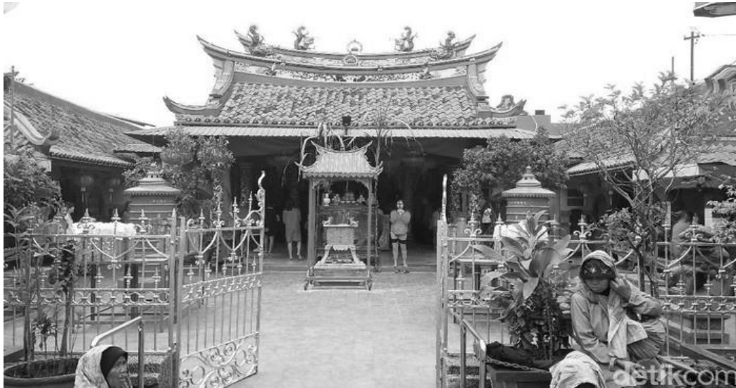
Gambar 3. Klenteng Boen Tek Bio