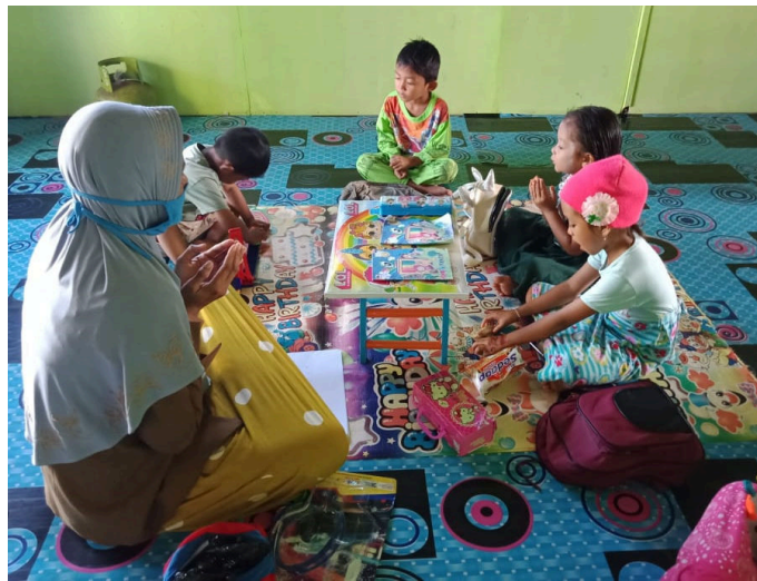
Gambar 1. Kegiatan Home visit

Guru-guru di RA Harapan Ibu menyusun jadwal kunjungan rumah untuk tiap orang sebanyak tiga kali seminggu. Anak-anak yang orang tuanya tidak memiliki smartphone dikumpulkan berdasarkan kedekatan jarak antar rumah. Setiap guru menangani tiga kelompok belajar yang terdiri dari anak-anak kelompok A dan B dengan rentang umur yang berbeda. Materi pembelajaran disesuaikan dengan umur anak. Para guru dari RA Harapan Ibu mengakui tidak bisa menuntaskan KI/KD yang sudah ditentukan dalam kurikulum karena keterbatasan waktu dan fasilitas pembelajaran saat home visit .