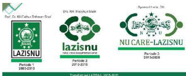
Gambar 1. Transformasi Logo NU-Care LAZISNU

Transformasi NU-Care LazisNU tidak sekedar perubahan logo, namun juga menyangkut transformasi sosial, nilai –nilai dan pemikiran. Hal ini terlihat dari adanya penguatan jejaring internal NU secara sosial dan ekologis.