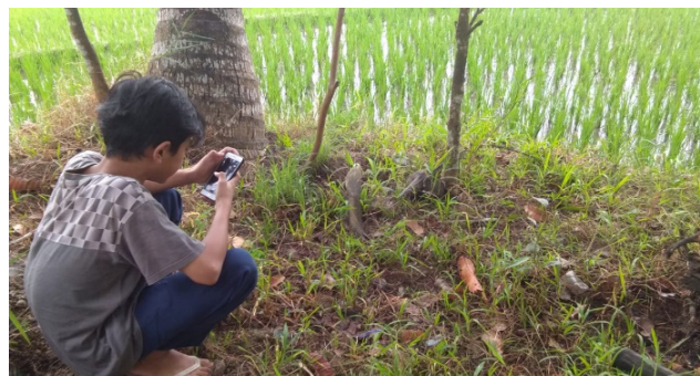
Salah seorang siswa (Izan) kelas VII berhasil memperoleh sinyal yang baik dan bisa langsung mengerjakan tugas dari seorang guru.

mengalami kesulitan jaringan internet. Kesulitan ini menjadikan siswa harus keluar rumah dan mencari lokasi yang tepat untuk memperoleh jaringan dan dapat belajar dengan nyaman. Kesulitan lain bagi siswa yang memiliki gaway adalah seringnya kehabisan kuota dan orang tua tidak mampu lagi membelikan kuota.